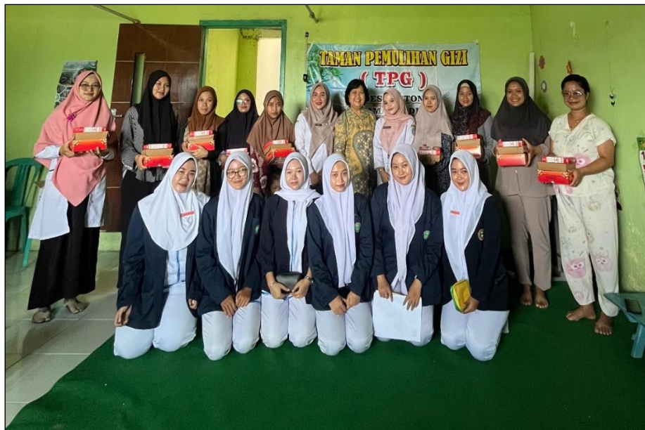
Gambar 2. Tim pengabdian bersama peserta ibu hamil di Desa Puton, Kecamatan Diwek, Kabupaten Jombang

Secara keseluruhan, hasil kegiatan menunjukkan bahwa pendekatan berbasis komunitas yang menggabungkan skrining dini, edukasi personal, distribusi TTD, dan evaluasi lanjutan mampu memberikan dampak positif dalam menurunkan beban anemia pada ibu hamil di Desa Puton. Pendekatan serupa direkomendasikan untuk diterapkan secara berkelanjutan melalui program Posyandu, Kelas Ibu Hamil, atau integrasi ke dalam layanan ANC di fasilitas kesehatan tingkat pertama.